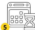
5 Гирiftани патент