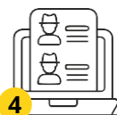
4 Пешниҳоди ҳуҷҷатҳо