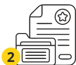
2 Подготовка документов