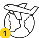
1 Прибытие в Россию

Патент на работу с возможностью неоднократного продления имеет ограниченный срок действия до 12 месяцев. Оплата производится за каждый месяц действия патента. Если не оплатить патент до указанной даты – он перестанет действовать!