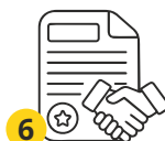
6 Приём на работу