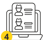
4 Подача документов