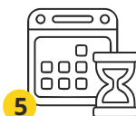
5 Получение патента